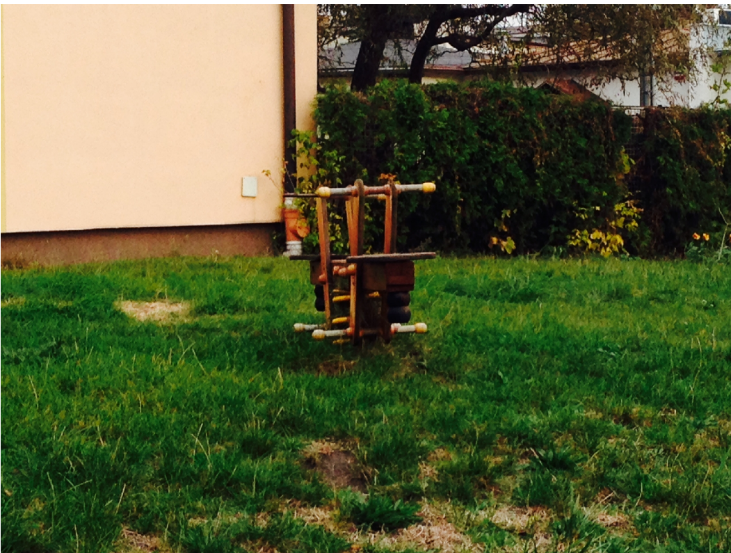
Zdjęcie 3: Bujak "Konik"