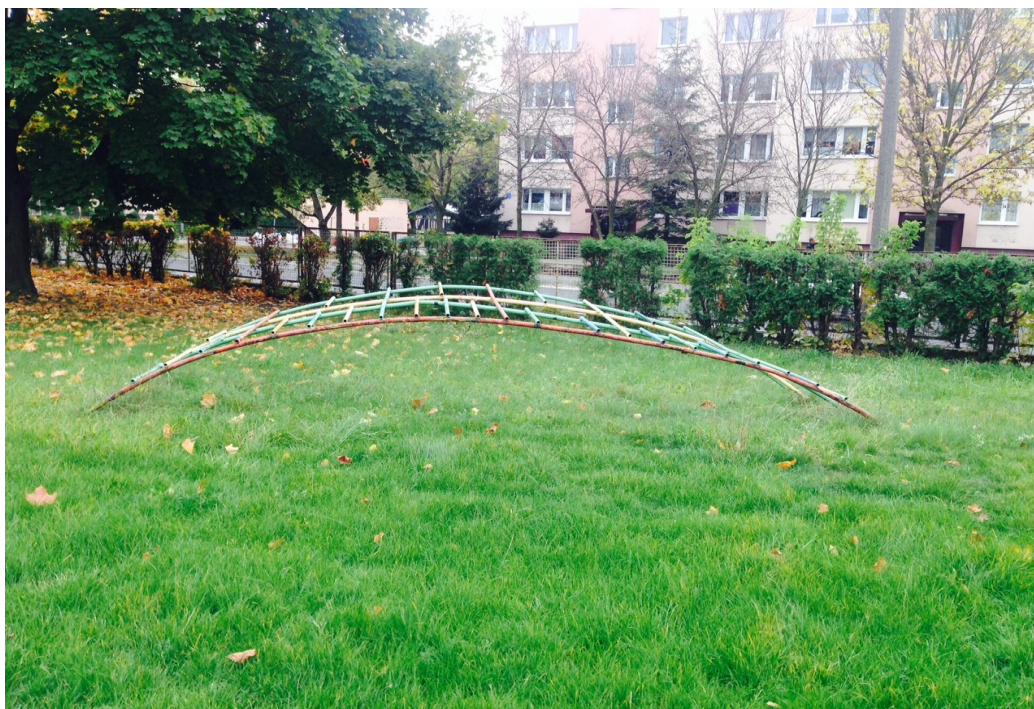
Zdjęcie 5: Drabinka łukowa metalowa

Natomiast w przeciwnym narożniku (narożnik wschodnio - południowy) zamontowana jest drabinka łukowa metalowa (zdjęcie nr 5)