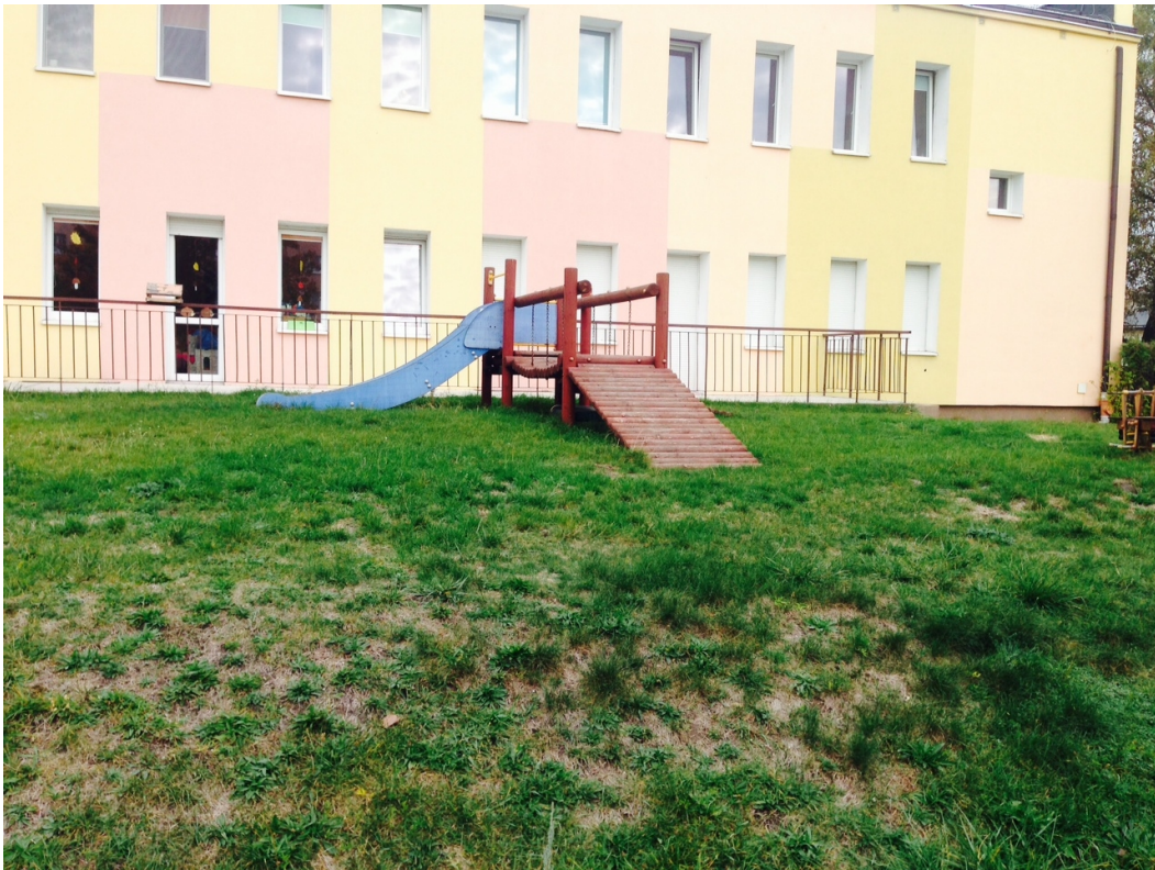
Zdjęcie 2: Pomost na łańcuchach z zjeżdżalnią metalową