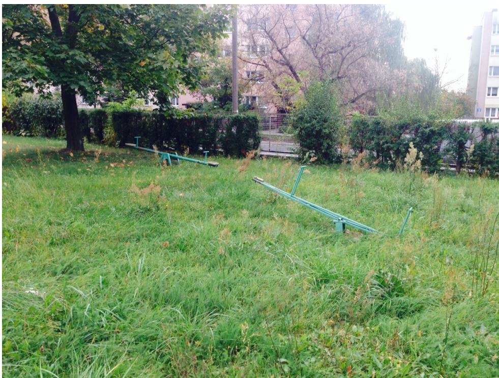
Zdjęcie 4: Huśtawki wagowe

Na niższym terenie w południowo zachodnim narożniku znajdują się dwie huśtawki wagowe (zdjęcie nr 4).