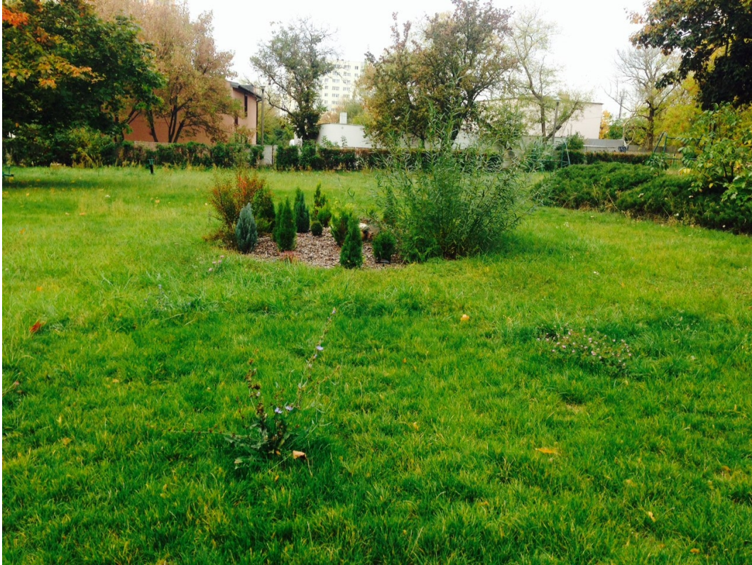
Zdjęcie 6: Klomby

Cały teren palcu zabaw jest porośnięty trawą. występują liczne drzewa i krzewy. Drzewa wysokie zlokalizowane są wzdłuż ogrodzenia od strony zachodniej i południowej oraz duży klon znajduje się przy zachodnio-południowym narożniku budynku żłobka. Dolna krawędź skarpy obsadzona jest młodymi tujami. W środkowej części placu zabaw zostały stworzone dwa klomby (zdjęcie nr 6).