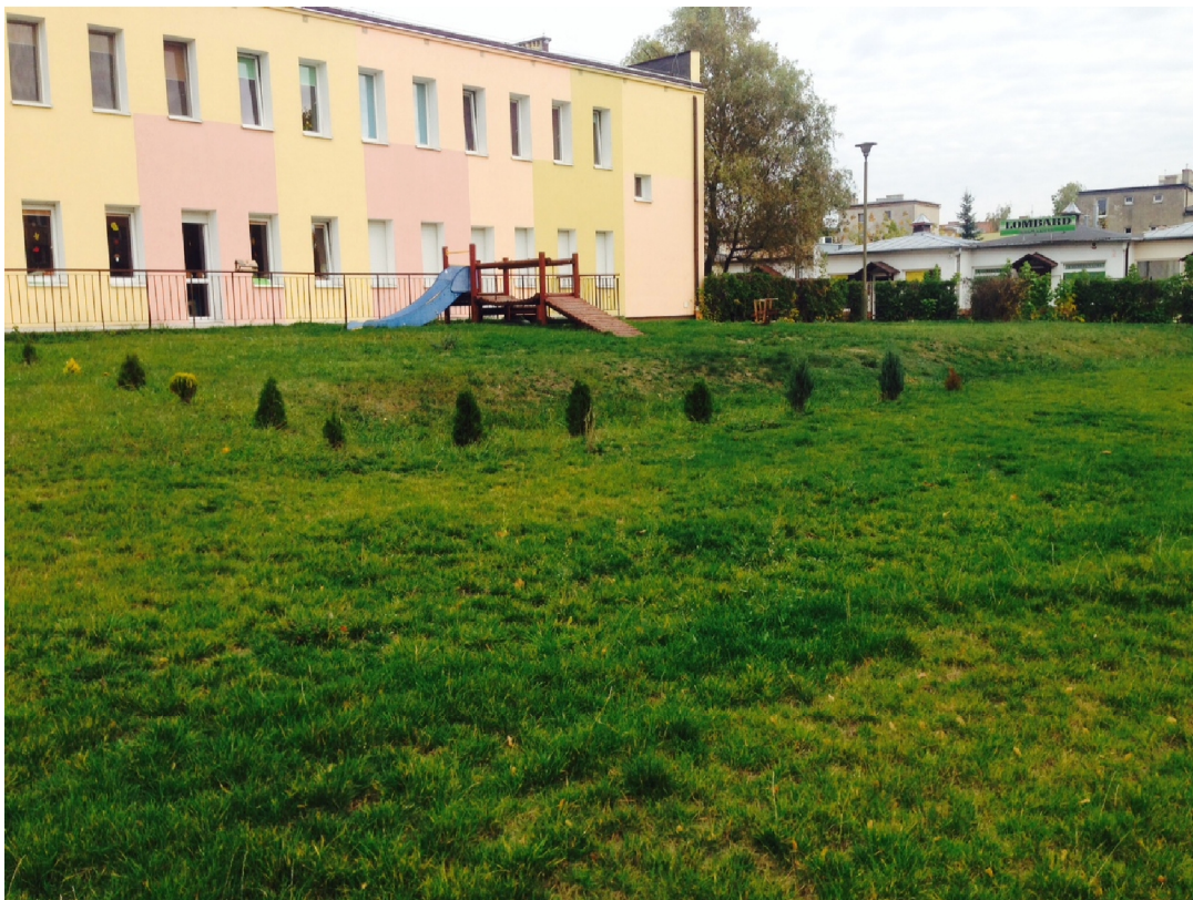
Zdjęcie 1: Różnica poziomów placu zabaw żłobka przy Brzozowej 28 w Bydgoszczy

Powierzchnia terenu zabaw jest dwu poziomowa. Wyższy znajduje się obok budynku a niższy od strony ulicy brzozowej (zdz. nr1). Komunikacja między poziomami odbywa się poprzez skarpe ziemną.